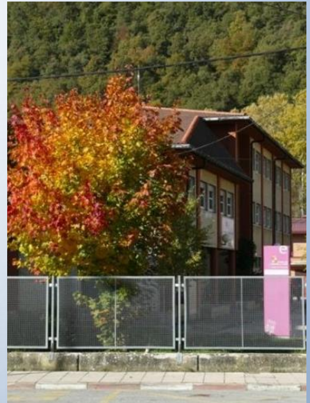
IESO CONDE SANCHO GARCÍA